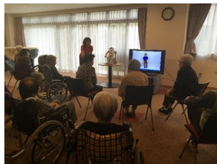
NAO と体操をするご入居者とスタッフ