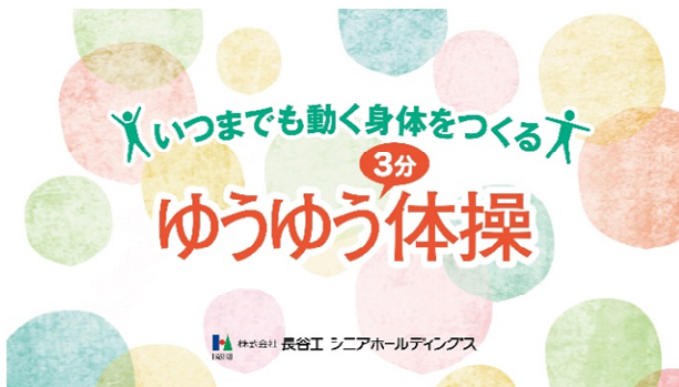
ゆうゆう体操タイトル