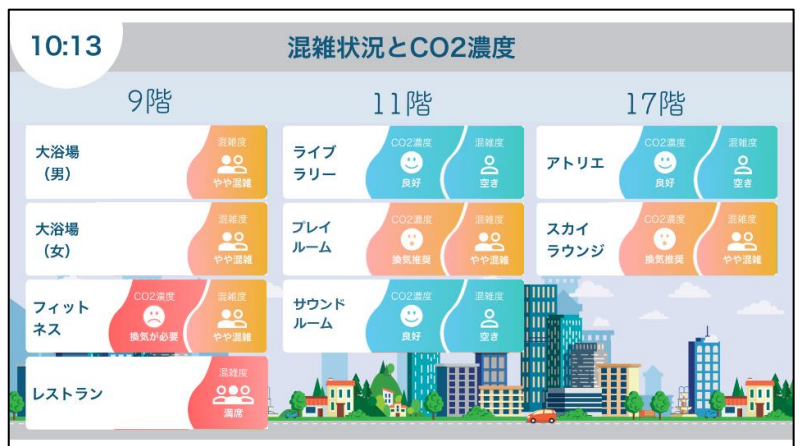
<共用施設の混雑度やCO 2 濃度を確認するテレビ画面>