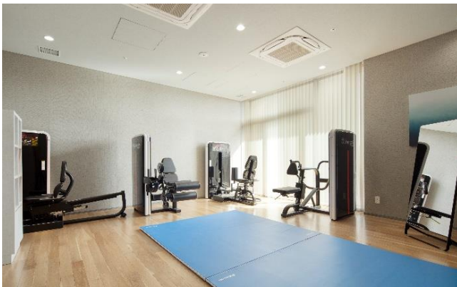
<フィットネスルーム>