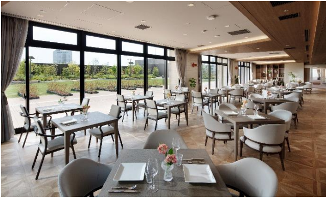
<レストラン・ラウンジ>

趣味・健康・知的好奇心の充足など様々なご要望にお応えするため、多彩な共用空間をご用意しており、日常の様々なシーンを館内で自由にお楽しみいただけます。