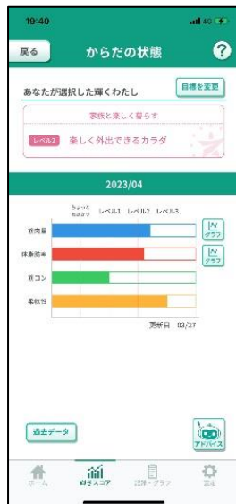
<長谷工オリジナルの健康サポートアプリ>