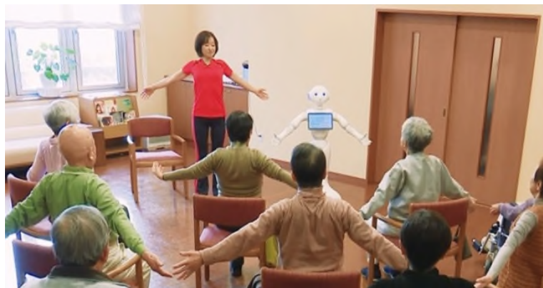
【「Pepper 版ゆうゆう体操」の実施風景】